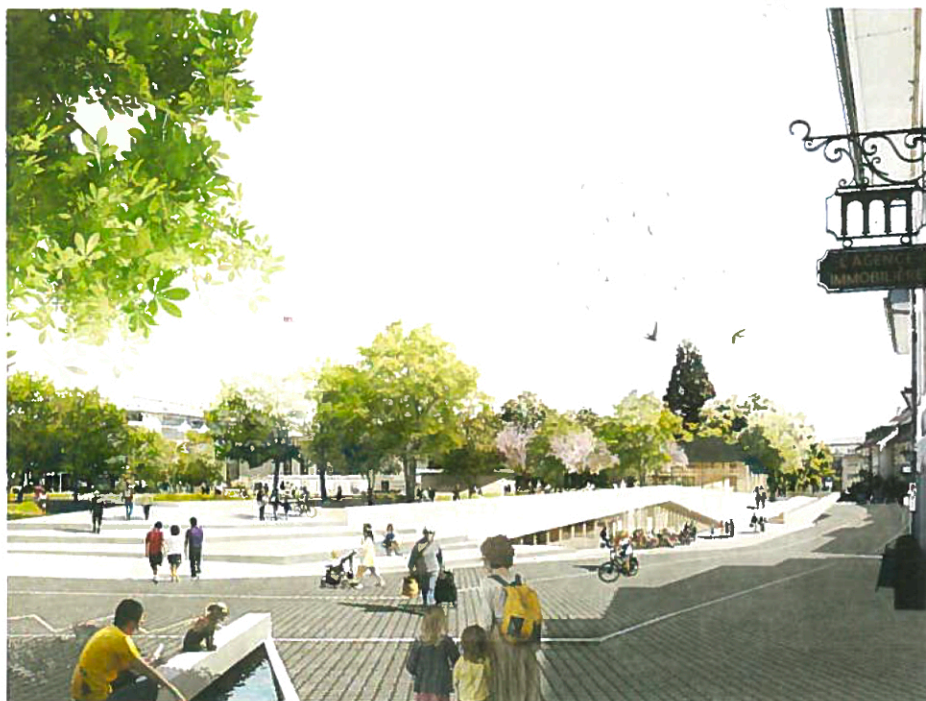
La place vue depuis la vieille ville. (LES DOCUMENTS ILLUSTRANT CET ARTICLE SONT DE PAYSAGESTION, LOCALARCHITECTURE, MRS PARTNER ET KUNG ET ASSOCIÉS)

parking de 450 places), ainsi que les enjeux politiques liés à ce type d'aménagements de grande envergure, ont conduit la Ville à rechercher un processus qui permette la rencontre, les échanges et la critique entre tous les acteurs: politiques, citoyens et équipes de concepteurs.